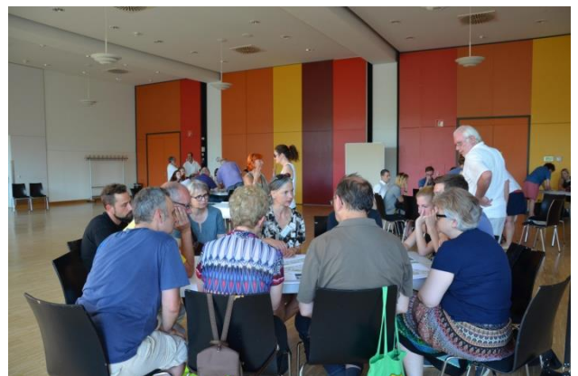
Juli 2016 Planungsworkshop Elisabethen-Anlage