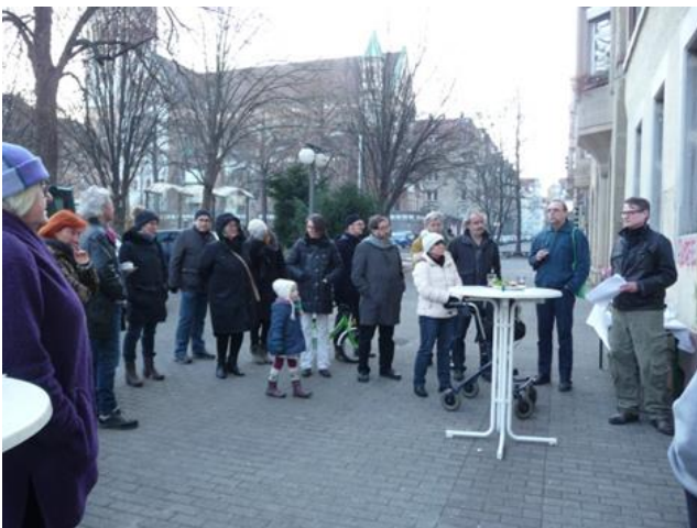
Platzgespräche Januar 2017

In 2016 standen an sieben Samstagen spannende Themen wie „Stuttgart reißt sich ab“ oder „Stuttgarter Westen - barrierefrei und inklusiv?“ auf der Agenda. Die Ergebnisse der Erkundung von Bismarckplatz und Elisabethen-Anlage aus Sicht von Menschen mit Behinderungen wurden in einem Bericht festgehalten und den Planern, die sich mit der Neugestaltung von Bismarckplatz und Elisabethen-Anlage befassen, zur Verfügung gestellt.