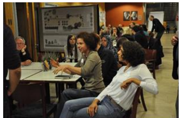
Bürgerbeteiligung im EKIZ September 2014