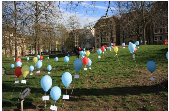
April 2015 "Elisabethen-Parcours"

Für die Villa Elisa wird es erst eine Untersuchung durch den Modernisierungsberater geben, dann wird auch über die Villa Elisa in der Bürgerbeteiligung beraten. Derzeit ist in der Villa Elisa ein Kindergarten untergebracht, der ins Gesundheitsamt umziehen wird. Die Schwabschule hat Bedarf für die Außenflächen angemeldet, aber auch für Räume im Gebäude selbst. Bereits jetzt ist die Schule sehr beengt und wenn das Olga-Areal bewohnt ist, kommen noch mehr Kinder dazu.