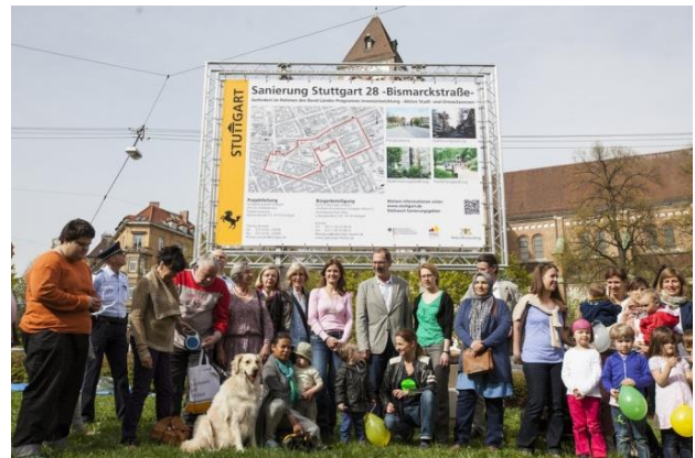
Einweihung Bauschild Bismarckplatz April 2014

Anschließend hat das Amt für Stadtplanung und Stadterneuerung der Landeshauptstadt Stuttgart die Ergebnisse der Projektgruppe geprüft und in die Aufgabenstellung für einen städtebaulichen Wettbewerb eingearbeitet. Der Ausschreibung wurde von der Projektgruppe geprüft, bevor der Entwurf an die Fachämter weitergeleitet wurde.