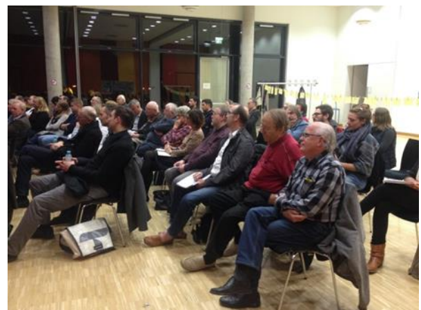
Öffentliche Auftaktveranstaltung Oktober 2016

Am 27. Oktober 2016 fand um 19:30 Uhr im Bürgerzentrum West die öffentliche Auftaktveranstaltung zur Umgestaltung der Schwabstraße statt. Schon lange besteht im Stuttgarter Westen der Wunsch, die Schwabstraße aufzuwerten. Besonders dem Abschnitt zwischen Bismarckplatz und Rotebühlstraße täte eine Erneuerung gut. Dabei gibt es unterschiedliche Interessen, die abgewogen werden müssen.