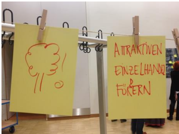
Öffentliche Auftaktveranstaltung Oktober 2016