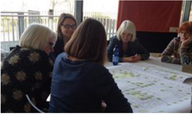
Workshop zur Schloßstraße im Februar 2017

Zwischen dem Workshop zur Gestaltung der Hasenbergstraße und dem Workshop Promenade Schloßstraße hat das Jugendamt eine Kinderwerkstatt an der Schwabschule durchgeführt. Beteiligt waren am 26.01.2017 Schülerinnen und Schüler der Klasse 2b. Die Ergebnisse sind beeindruckend, es gibt viele Übereinstimmungen in den Vorstellungen der Kinder zu denen der Erwachsenen, aber auch Unterschiede.