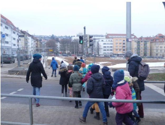
Kinderbeteiligung Januar 2017

Zwischen dem Workshop zur Gestaltung der Hasenbergstraße und dem Workshop Promenade Schloßstraße hat das Jugendamt eine Kinderwerkstatt an der Schwabschule durchgeführt. Beteiligt waren am 26.01.2017 Schülerinnen und Schüler der Klasse 2b. Die Ergebnisse sind beeindruckend, es gibt viele Übereinstimmungen in den Vorstellungen der Kinder zu denen der Erwachsenen, aber auch Unterschiede.